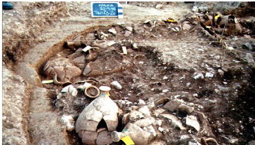
Αμφορείς από το λιμάνι του Ηρακλείου.

Χαρακτηριστικό παράδειγμα αποτελεί, ο εντοπισμός τμήματος του λιμανιού της πόλης του Ηρακλείου, ο εντοπισμός ενός αφιδωτού κτιρίου που ανάγεται στους Γεωμετρικούς χρόνους, καθώς και άλλα πολλά σημαντικά αρχαιολογικά ευρήματα.