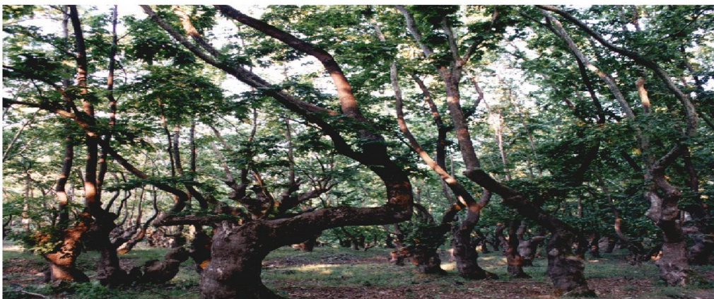
Το αιωνόβιο πλατανόδασος των Λειβήθρων.

Ο αρχαιολογικός χώρος εκτείνεται στην παραολύμπια ζώνη των δημοτικών διαμερισμάτων της Λεπτοκαρυάς και της Σκοτίνας του δήμου Δίου - Ολύμπου. Περιβάλλεται από τις κοίτες των χειμάρρων, που καλύπτονται από αιωνόβιο πλατανόδασος, σίγουρα το ομορφότερο του Ολύμπου.